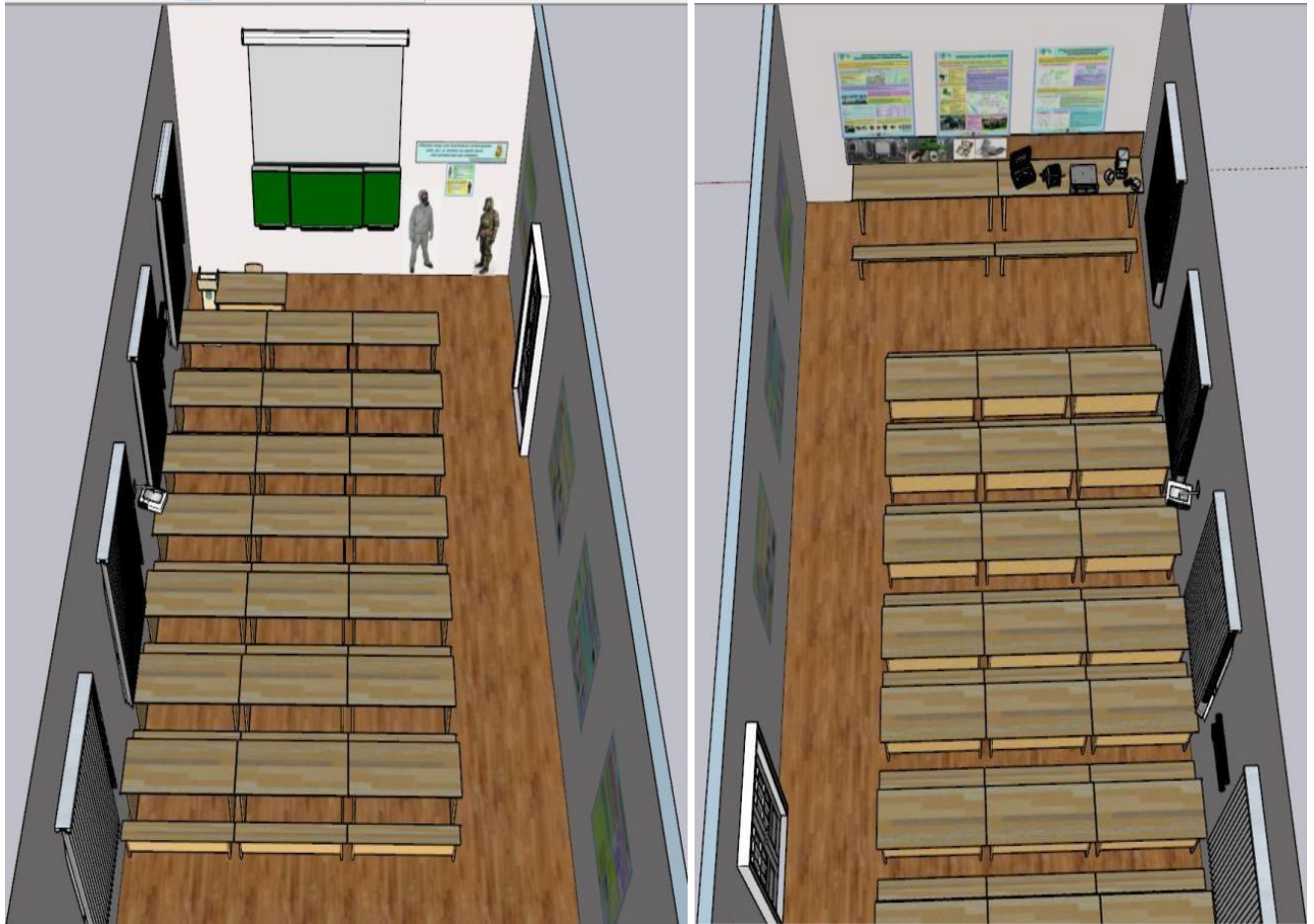
Фронтальний вид навчального класу